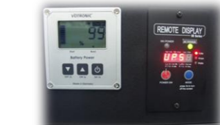
機能的で見やすい コントロールパネル